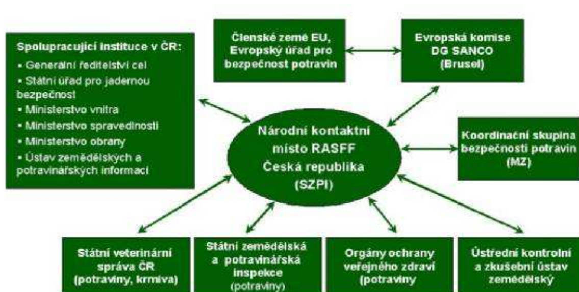
Schéma fungování systému rychlého varování RASFF v ČR: